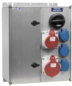
VOIMA 023 RST VOIMA 113 RST

Pistorasiakeskukset ovat valmistettu sinkitystä tai ruostumattomasta teräksestä. Pistorasioiden ja suojalaitteiden asennuslevyt on saranoitu, jolloin koko keskuksen kotelo avautuu syöttökaapelin kytkentätilaksi. Kotelon ylä- ja alapäässä on MC3 multilaippa.