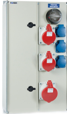
VOIMA 0033 VOIMA 0123