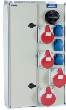
VOIMA 0043 VOIMA 0133 VOIMA 0223 VOIMA 0313