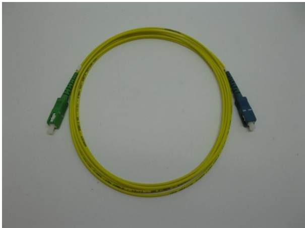
SC-APC/SC-UPC/1/3 SM kytkentäk.