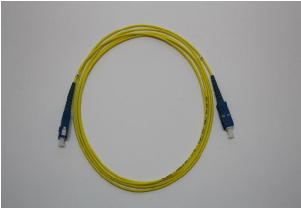
SC/SC/1/3 SM kytkentäk.