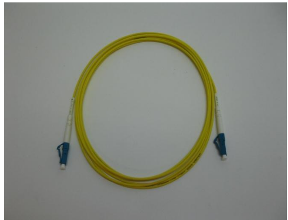
LC/LC/1/3 SM kytkentäk.