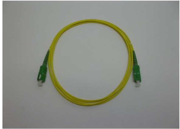
SC-APC/SC-APC/1/2 SM kytkentäk.